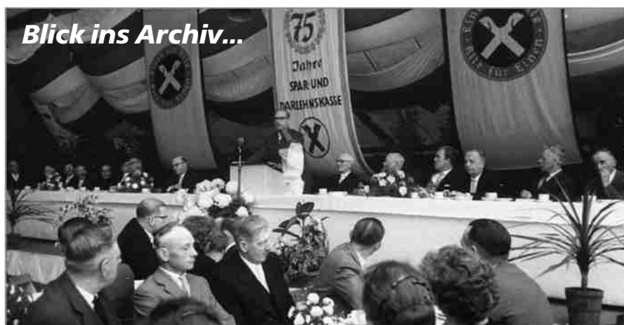
Jubiläums-Generalversammlung der Spar- und Darlehnskasse Raesfeld vor 50 Jahren.

Der Mitglieder-Brief erscheint in unregelmäßigen Abständen. Er wird an Mitglieder der Volksbank Raesfeld eG ab 14 Jahre versandt.