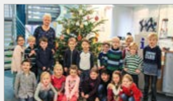
Weihnachtsbaumschmücken durch die Kinder des Ev. Lukas-Kindergartens