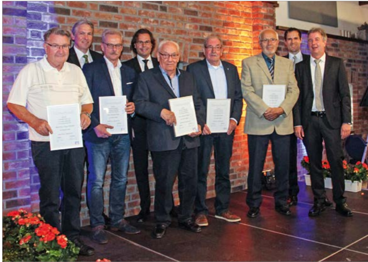
Die geehrten Jubilare auf der Generalversammlung 2017