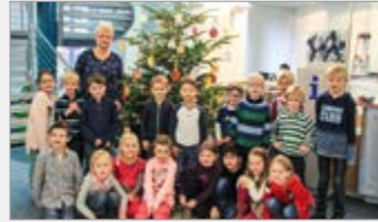
Weihnachtsbaumschmücken durch die Kinder des Ev. Lukas-Kindergartens