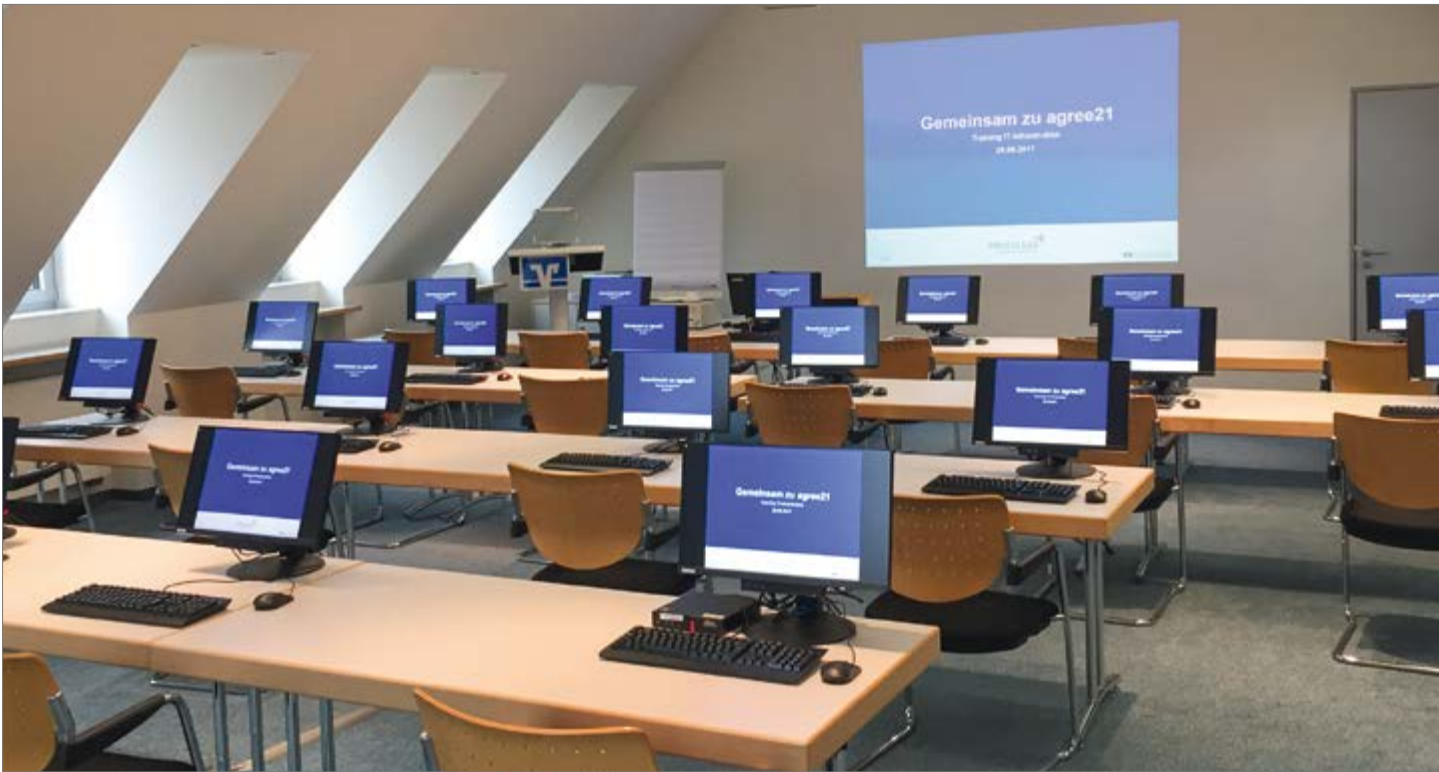
Im Schulungsraum der Volksbank Raesfeld finden regelmäßig Vorbereitungen für die Umstellung auf die neue Software statt.