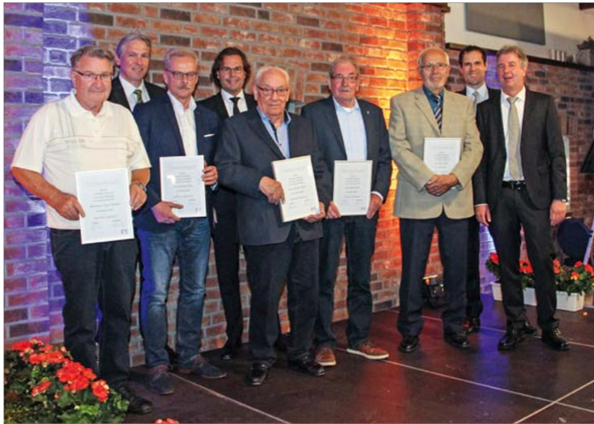
Die geehrten Jubilare auf der Generalversammlung 2017